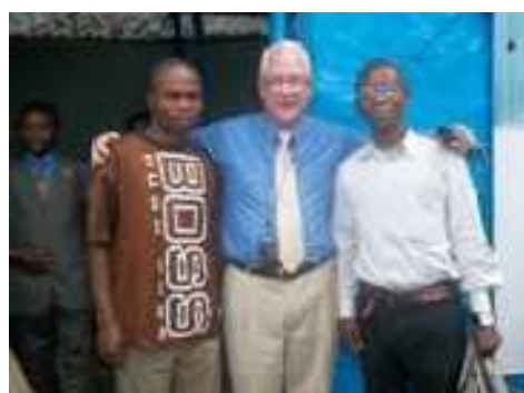
A vida e a mensagem do ir. Don trouxe um real companheirismo entre os irmãos.