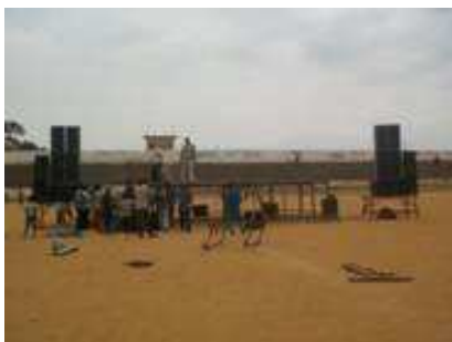
Materialis preparados para a campanha