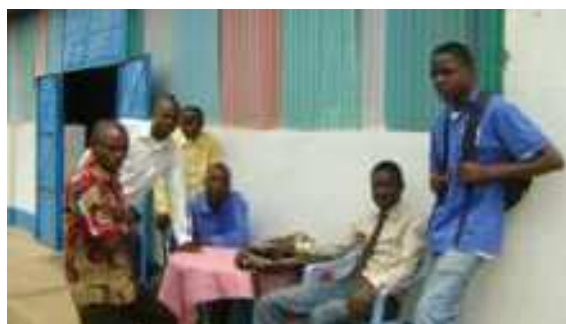
Livros de estudo dados aos ministros por jovens consagrados à obra missionária

O segundo estudo foi de outro livro, intitulado “Aquele Que Crê” . Este estudo mostrou que a promessa de João 14:12 possui duas partes, as obras e as obras maiores (ou mais obras). O crente sendo conforme a imagem do Filho Primogênito, tendo recebido o Deus-Vida manifestará em sua vida a mesma vida, as mesmas ações e as mesmas obras que Jesus Cristo fez. Essa é uma promessa de Deus.