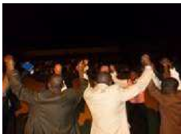
Ministros em unidade unindo as mãos em oração