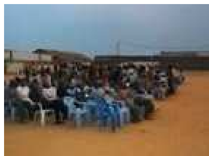
Pouco mais de 400 pessoas vieram em grande expectativa esperando pela campanha começar