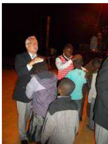
Ministros impondo as mãos sobre pessoas necessitadas